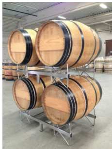
Fasslager aus Edelstahl