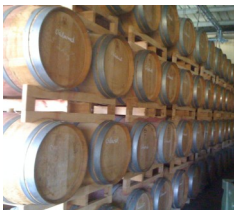
Fasslager aus Eschenholz